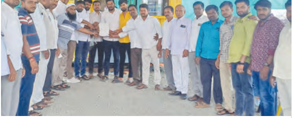
లడ్డిదారులకు చెక్కులు పంపిణీ చేస్తున్న టిఆర్ఎస్ నాయకులు