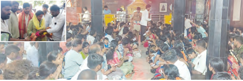
అభిషేకాలకు తరలి వచ్చిన భక్తులు. (ఇన్సెటి)డిసీఎం సతీమణిని సత్కరిస్తున్న దృశ్యం