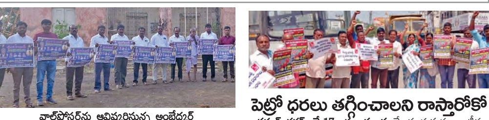
వారోత్సవం ఆవిష్కరిస్తున్న అంబేద్కర్ యువజన సంఘం సభ్యులు