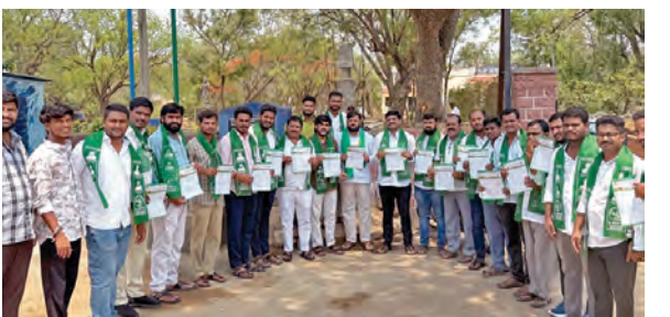
మహా ధర్మ కరవత్రాలను విడుదల చేస్తున్న ఎల్.పావీషిన్ నాయకులు