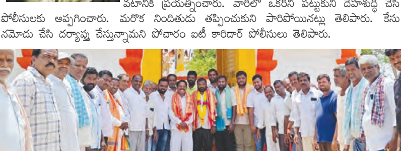
వెంకటేశ్వర స్వామి దేవాలయం నూతన కమిటీ సభ్యులు

ఘట్టేసర్ రూరల్, మే 17, ప్రభాతవార్త: పోచారం ఐటీ కారిడార్ పోలీస్ స్టేషన్ పరిధిలోని యునంపేట్ లో తాళం వేసి ఉన్న ఇండ్లలో దొంగతానానికి యల్పించిన నేపాలీకి చెందిన ఒకరిని స్థానికులు పట్టుకుని పోలీసులకు అప్పగించిన సాంఘటన శనివారం రాత్రి చోటుచేసుకుంది. యునంపేట్ లోని సాయి తేజ కాలనీలో రాత్రి దాచాపు 11 గంటల సమయంలో నేపాలీకి చెందిన ఇద్దరు వ్యక్తులు తాళం వేసి ఉన్న ఓ ఇంటి తాళం పగులగొట్టి దొంగతానానికి యల్పించారు. గమనించిన స్థానికులు వెంటదండవంతో అక్కడి నుంచి వరక పటానికి ప్రయత్నించారు. వారిలో ఒకరిని పట్టుకుని దేహశుద్ధి చేసి పోలీసులకు అప్పగించారు. మరొక నిందితుడు తప్పించుకుని పారిపోయినట్లు తెలిపారు. కేసు నమోదు చేసి దర్యాప్తు చేస్తున్నారని పోచారం ఐటీ కారిడార్ పోలీసులు తెలిపారు.